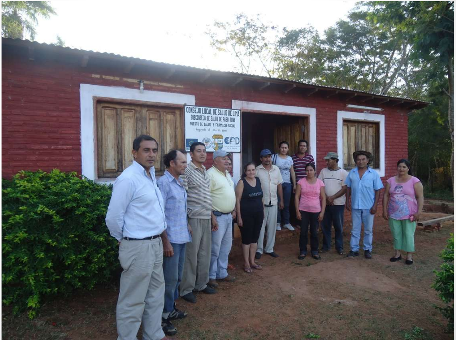
Local Health Council – integrating community members