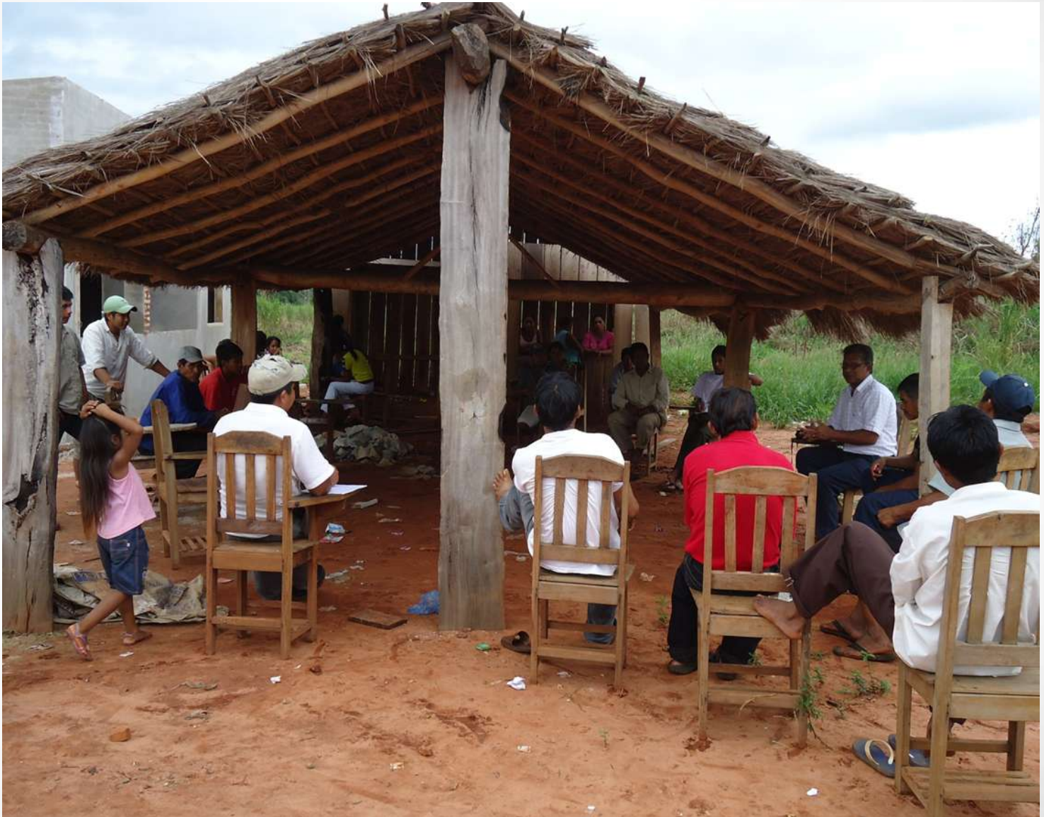
Gathering of Community leaders